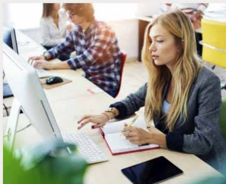
Läxornas vara eller inte vara är en kontroversiell fråga. Forskarnas studier är inte entydiga och det är många faktorer som spelar roll.

– Jag är verkligen inte emot att eleverna pluggar. De måste räkna, räkna och räkna. De måste plugga