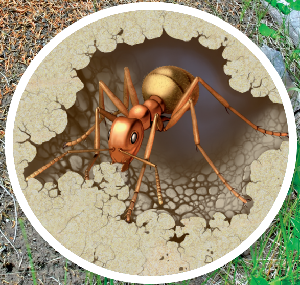
All jord i den här stacken har grävts upp av gula myror.

Myror har inga verktyg. De måste gräva och bygga med munnen och benen. Tänk om människor skulle bygga höghus på det sättet!