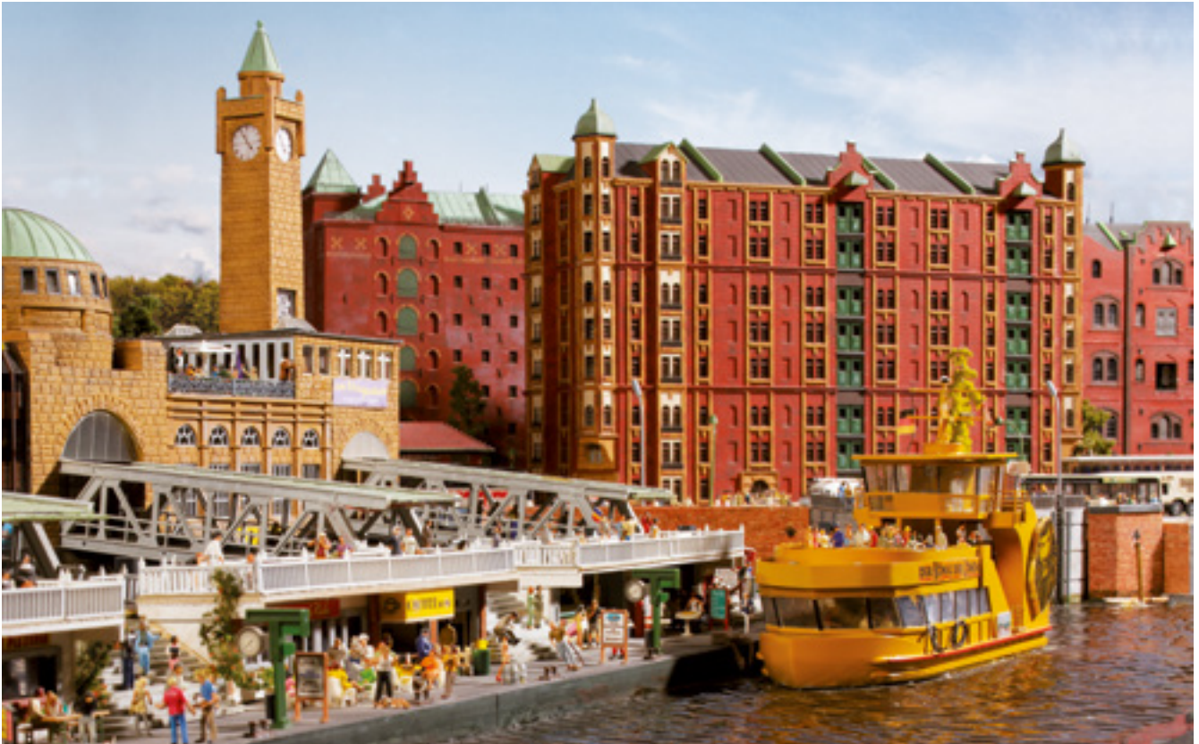
Die Hamburger Speicherstadt mit Landungsbrücken