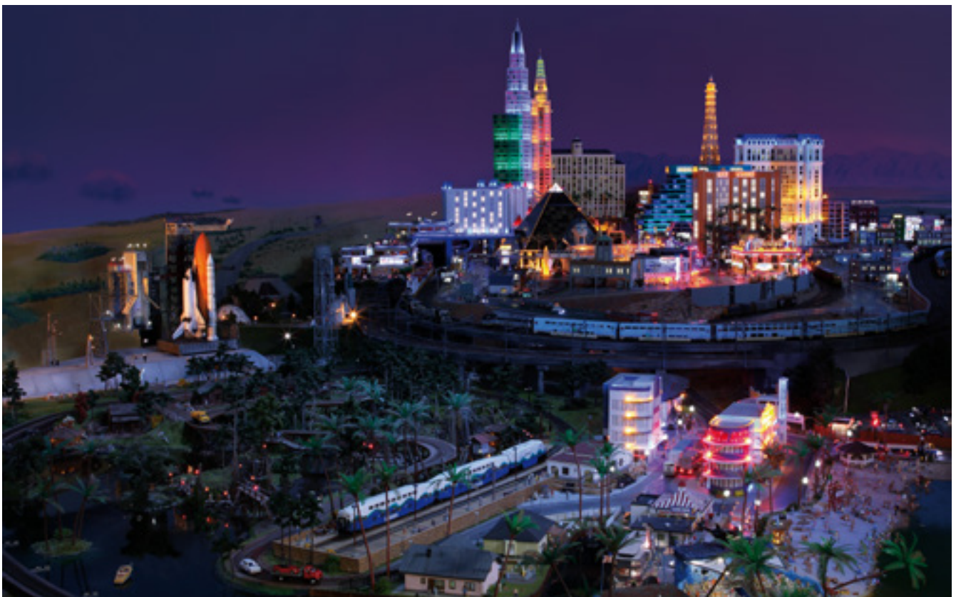
Las Vegas bei Nacht