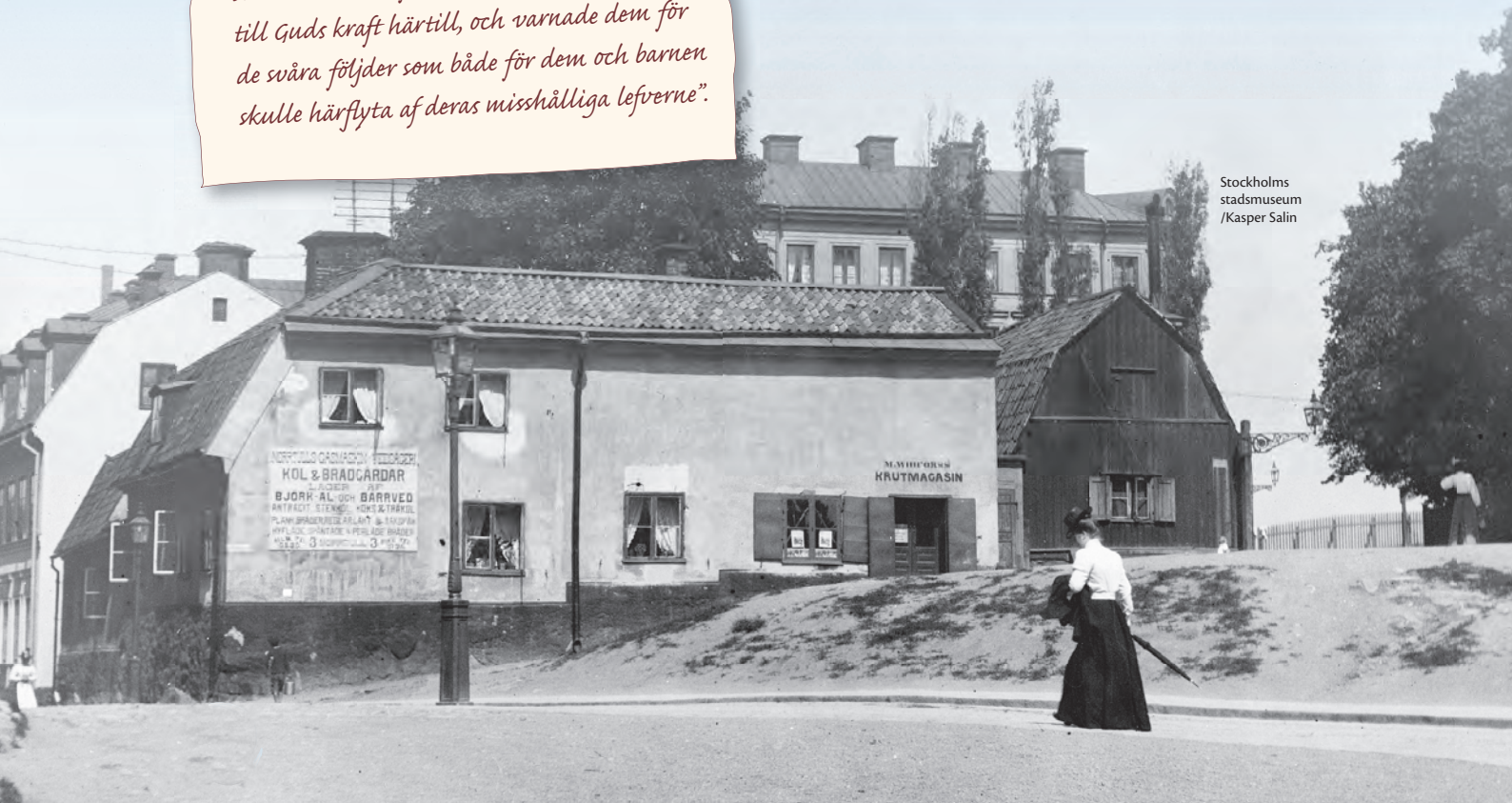
Stockholms stadsmuseum /Kasper Salin