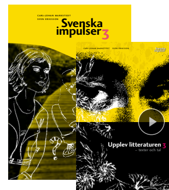
Kursen svenska 3