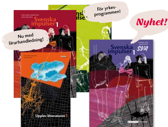
Kursen svenska 1 – svenska som andraspråk 1