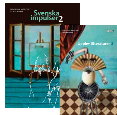
Kursen svenska 2